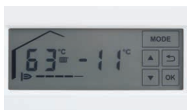
Osvetljen LCD zaslon na dotik

* Ob sklenitvi pogodbe o vzdrževanju. Več o podaljšanju garancije na www.viessmann.com