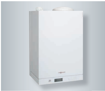
Vitodens 111-W z integriranim 46 l hranilnikom vode iz plemenitega jekla