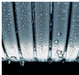
Prenosnik toplote Inox-Radial, učinkovit in z dolgo življensko dobo

Vitodens 100-W Vitodens 111-W 4,7 do 35,0 kW